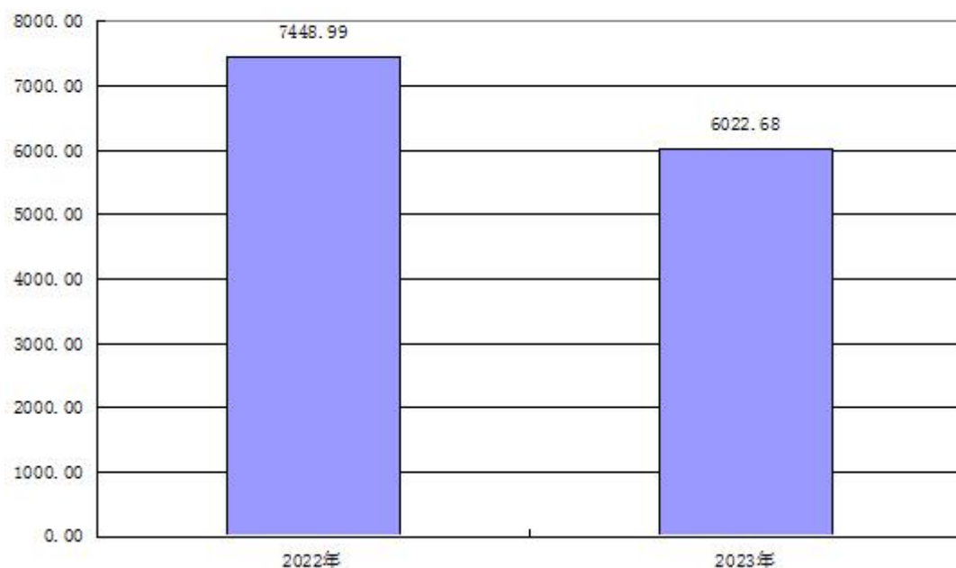
图1：收、支决算总计变动情况